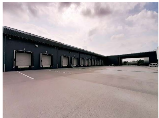
群馬ターミナル倉庫 (3,740㎡)