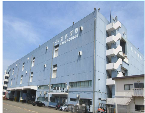
本牧保税蔵置場(K I F C) (11,537㎡)